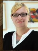
Enrice Huber Verwaltung